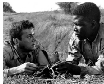
1958 LA CHAÎNE (The Defiant Ones) de Stanley Kramer avec Sidney Poitier