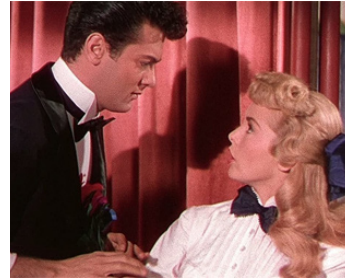
1953 HOUDINI LE GRAND MAGICIEN (Houdini) de George Marshall avec Janet Leigh