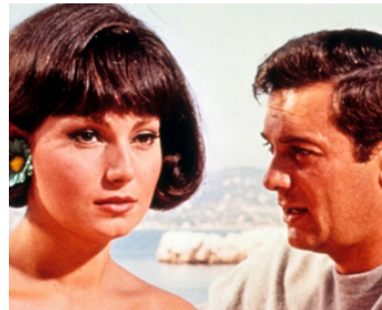
1966 ARRIVEDERCI BABY de Kenneth Hughes avec Lionel Jeffries, Rossana Schiaffino