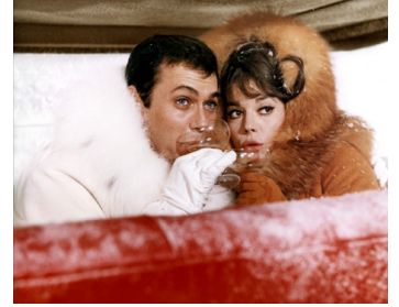
1965 LA GRANDE COURSE AUTOUR DU MONDE (The Great Race) de B. Edwards avec Natalie Wood