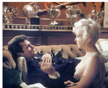
1959 CERTAINS L'AIMENT CHAUD (Some like it hot) de Billy Wilder avec Marilyn Monroe