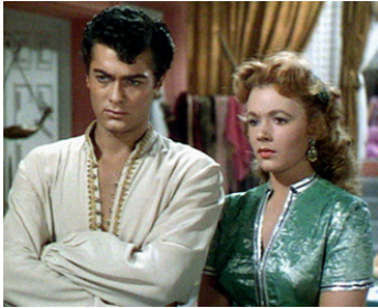
1952 LE FILS D'ALI BABA (Son of Ali Baba) de Kurt Neumann avec Piper Laurie