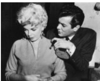
1957 LE GRAND CHANTAGE (Sweet Smell of Success) d'A. Mackendrick avec Barbara Nichols