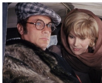
1969 GONFLÉS À BLOC (Monte Carlo or Bust) de Ken Annakin avec Susan Hampshire