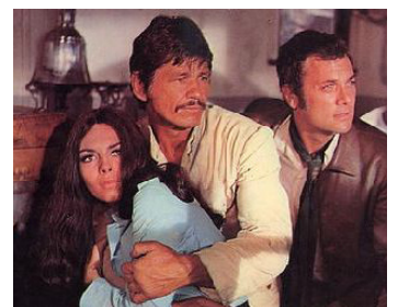
1970 LES BAROUDEURS (You can't win 'em all) de Peter Collinson avec N. Wood, Ch. Bronson