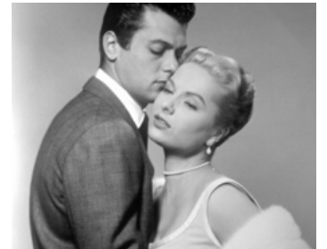
1957 L'EXTRAVAGANT MONSIEUR CORY (Mister Cory) de Blake Edwards avec M. Hyer