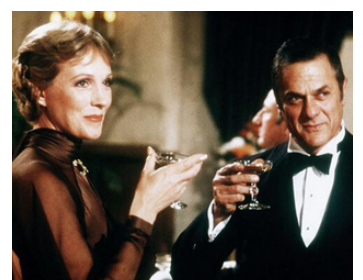
1980 LA PUCE ET LE GRINCHEUX (Little Miss Marker) de Walter Bernstein avec Julie Andrews