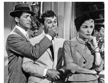
1960 QUI ÉTAIT DONC CETTE DAME (Who was that Lady?) de G. Sidney avec D. Martin, J. Leigh