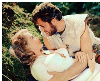
1958 LES VIKINGS (The Vikings) de Richard Fleischer avec Janet Leigh