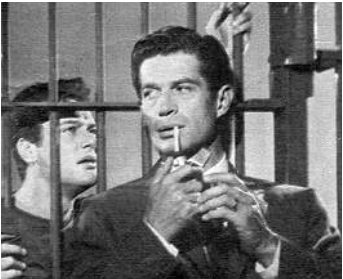
1955 LA POLICE ÉTAIT AU RENDEZ-VOUS (Six Bridges to Cross) de J. Pevney avec George Nader