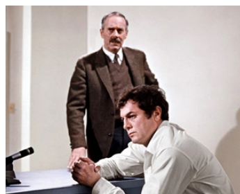
1968 L'ÉTRANGLEUR DE BOSTON (The Boston Strangler) de R. Fleischer avec Henry Fonda