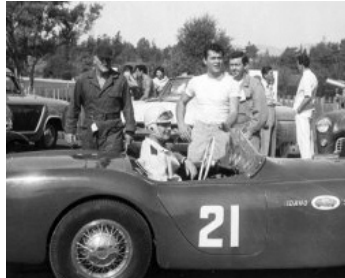
1954 LES BOLIDES DE L'ENFER (Johnny Dark) de George Sherman