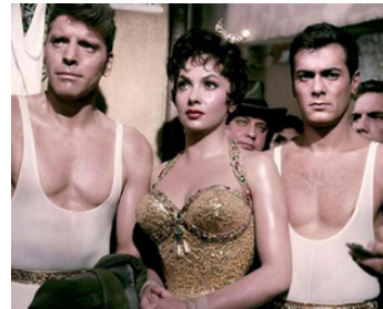
1956 TRAPÈZE (Trapeze) de Carol Reed avec Burt Lancaster, Gina Lollobrigida