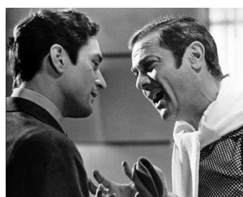
1976 LE DERNIER NABAB (The Last Tycoon) d'Elia Kazan avec Robert De Niro