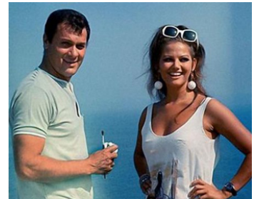
1967 COMMENT RÉUSSIR EN AMOUR... (Don't make Waves) d'A. Mackendrick avec C. Cardinale