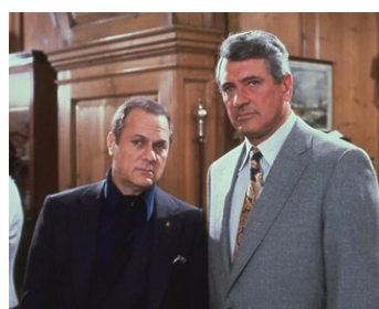
1980 LE MIROIR SE BRISA (The Mirror crack'd) de Guy Hamilton avec Kim Novak