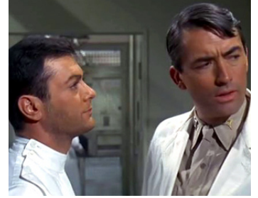
1963 LE COMBAT DU CAPITAINE NEWMAN (Captain Newman MD) de D. Miller avec G. Peck