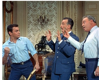
1966 SURTOUT PAS AVEC MA FEMME (Not with my wife, you don't) de N. Panama avec George C. Scott