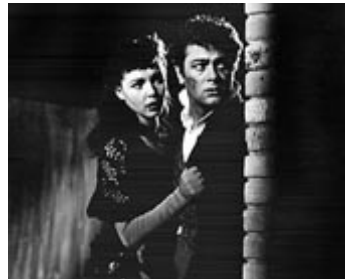
1955 LES ANNÉES SAUVAGES (The Rawhide Years) de Rudolph Maté avec Coleen Moore