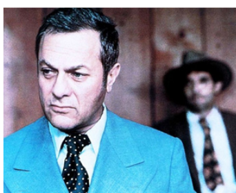
1974 LEPKE LE CAID (Lepke) de Menahem Golan