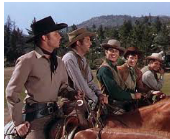
1950 KANSAS EN FEU (Kansas Raiders) de Ray Enright avec Audie Murphy