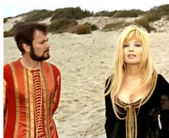
1967 LA CEINTURE DE CHASTÉTÉ (La cintura di castita) de P. Festa Campanile avec Monica Vitti