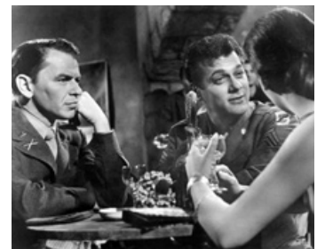
1958 LES DIABLES AU SOLEIL (Kings go Forth) de Delmer Daves avec Frank Sinatra