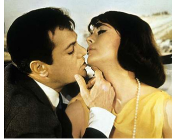
1964 UNE VIERGE SUR CANAPÉ (Sex and the Single Girl) de Richard Quine avec Natalie Wood