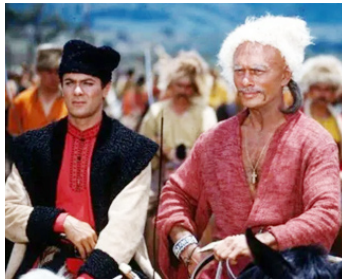
1962 TARASS BOULBA (Tarass Boulba) de J. Lee Thompson avec Yul Brynner