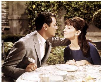
1964 LA MARIÉE A DU CHIEN (Wild and Wonderful) de M. Anderson avec Christine Kaufman