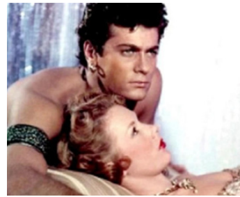
1951 LE VOLEUR DE TANGER (The Prince who was a Thief) de Rudolph Maté avec Piper Laurie