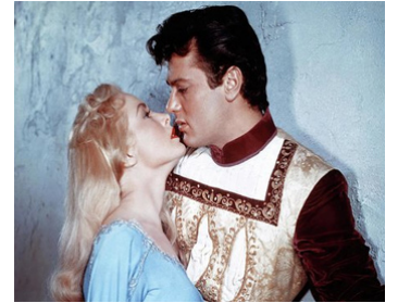
1954 LE CHEVALIER DU ROI (The Shield of Falworth) de Rudolph Maté avec Janet Leigh