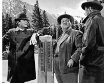
1963 DES ENNUIS À LA PELLE (Forty Pounds of Trouble) de Norman Jewison