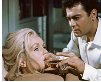
1964 AU REVOIR CHARLIE (Goodbye Charlie) de Vincente Minnelli avec Debbie Reynolds