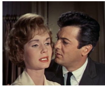
1960 LES PIÈGES DE BROADWAY (The Rat Race) de Robert Mulligan avec Debbie Reynolds