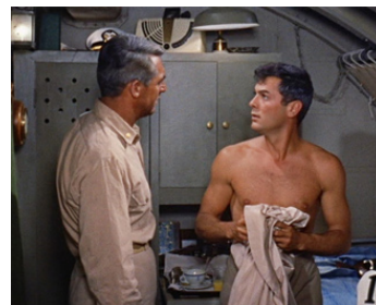
1959 OPÉRATION JUPONS (Operation Petticoat) de Blake Edwards avec Cary Grant