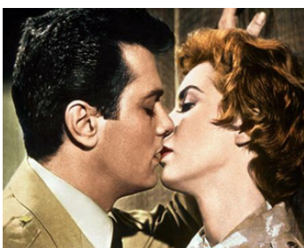
1958 VACANCES À PARIS (The Perfect Furlough) de Blake Edwards avec Janet Leigh