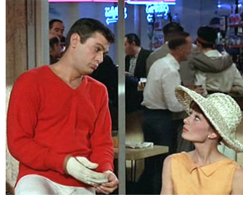
1962 PARIS QUI PÉTILLE (Paris when it sizzles) de Richard Quine avec Audrey Hepburn