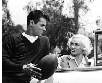
1953 LE DÉMON BLOND (The All American) de Jesse Hibbs avec Lori Nelson