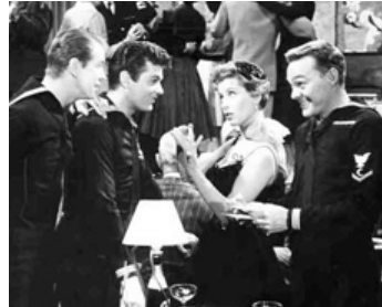
1955 ÇA C'EST PARIS (So this is Paris) de Richard Quine avec Gene Nelson, Corinne Calvet