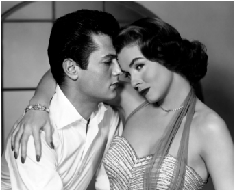
1953 DOUBLE FILATURE (Forbidden) de Rudolph Maté avec Joanne Dru