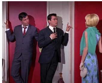
1965 BOEING BOEING (Boeing Boeing) de John Rich avec Jerry Lewis, Dany Saval