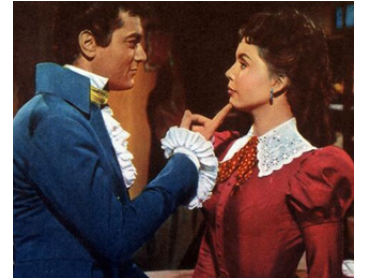
1955 LE CAVALIER AU MASQUE (The Purple Mask) de Br. Humberstone avec Coleen Moore