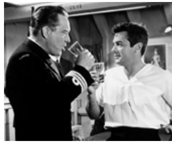
1961 LE ROI DES IMPOSTEURS (The Great Impostor) de R. Mulligan avec Edmond O'Brien