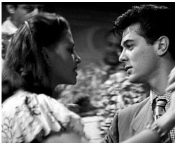
1949 POUR TOI J'AI TUÉ (Criss Cross) de Robert Siodmak